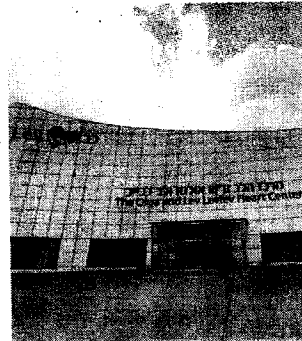
מבנה בביה"ח שיבא